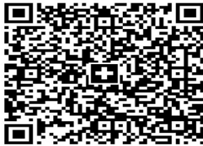
QR - Code Ausstellungskonto

Die Anmeldung erfolgt mittels Anmeldeformulars, das Standgeld muss mit beiliegendem Einzahlungsschein oder online auf das Konto Nr: CH 77 0631 3016 0382 7490 6 Bernerland Bank AG, Sumiswald – KZV Wyssachen einbezahlt werden. Sämtliche Anmeldungen, welche nicht bis am 03.12.2024 einbezahlt worden sind, werden nicht berücksichtigt.